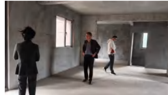
4月21日, 顺民置业销售、工程人员现场选定落实销售样板间建设工作