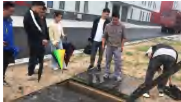
4月21日, 红安县泛家居产业园项目工程消防检测