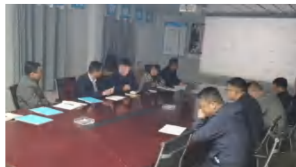
4月29日, 武穴天地项目弱电智能化安装品牌方案会议