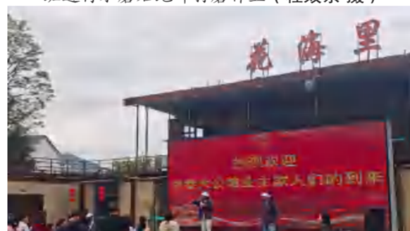
4月11日, 顺民置业组织团风中泰大公馆业主到四季花海开展团建活动