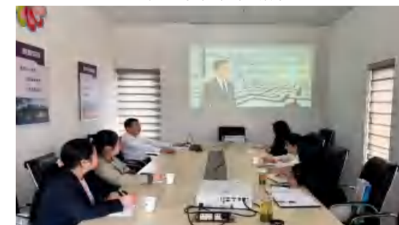
4月20日, 中信仁和集团人力行政管理专题培训会在四季花海举行