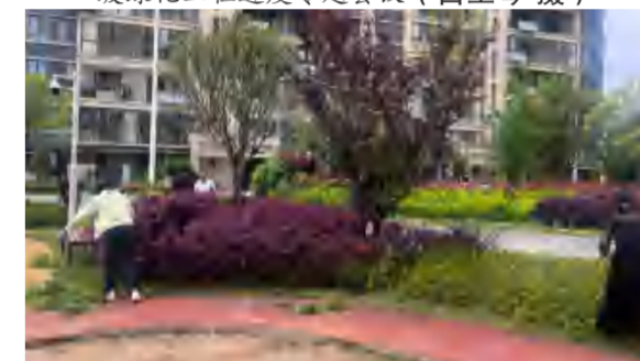
4月16日, 花海置业公司在九龙湾A区全员义务劳动