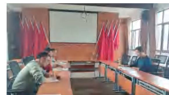
4月10日, 四季花海农业公司召开英山花海大道护坡绿化工程进度专题会议