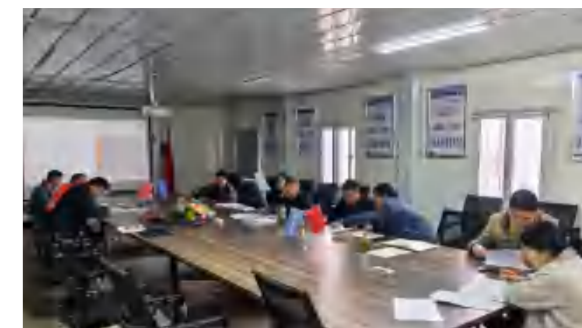
4月3日, 红安县人民医院新院区二期项目后勤综合楼第一批装饰材料认价会(王敬摄)