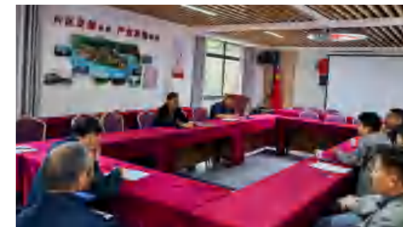
5月7日, 六合众物业公司组织召开物业特种设备维保单位专题会议