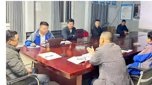
4月21日, 武穴天地项目2#、5#楼管井内安装定位分布专题会议