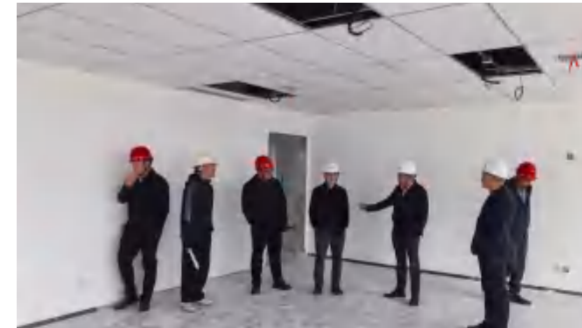
4月22日, 红安县人民医院主要领导在新院区现场察看后勤建设施工进度情况