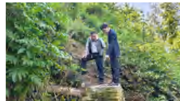
5月6日, 花海置业、六合众物业负责人现场研究落实九龙湾C区后山汛期排水解决方案