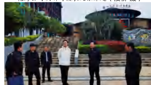
4月13日, 黄冈市民政局领导与四季花海公司领导现场研究五一活动