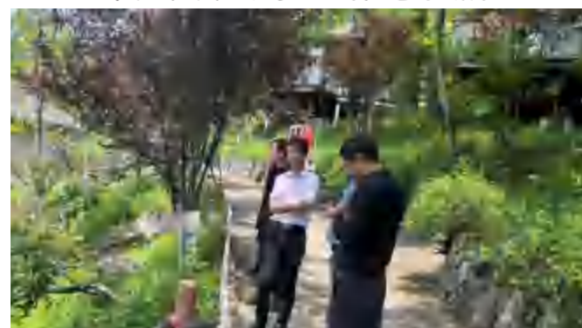
4月18日, 四季花海董事会成员现场视察研究养心苑酒店屋外升级改造工程