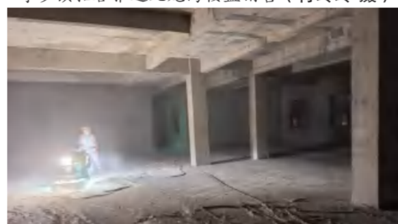
4月4日, 中信仁和制造基地特校装修工程项目加班进行水磨石地坪打磨作业