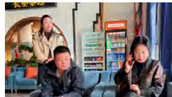
4月1日, 四季花海旅游营销中心外出拜访大客户对接业务