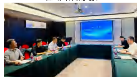
4月10日, 黄冈市农业农村局、市农科院在四季花海公司调研对接文旅课题