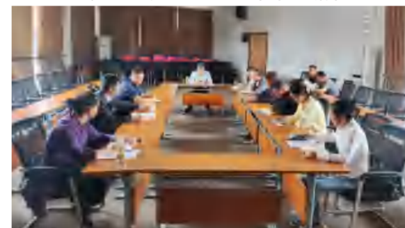
4月20日, 花海旅游公司专题研究公司采购供应工作